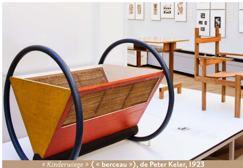
« Kinderwiege » (« berceau »), de Peter Keler, 1923

La catégorie des métiers d'artisanat d'art bouscule encore cette distinction car ils sont grandement mis au service de démarches artistiques que l'on pense aux esthétiques foraines et de rue ou à ces catégories d'art hybrides comme les arts textiles.