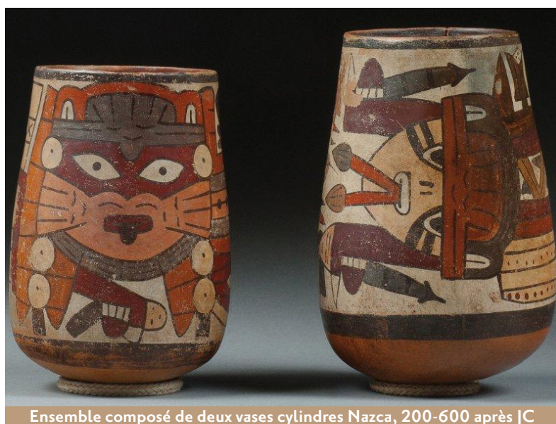
Ensemble composé de deux vases cylindres Nazca, 200-600 après JC