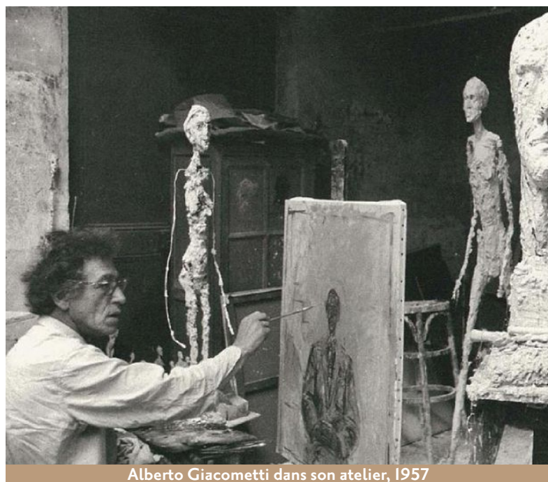
Alberto Giacometti dans son atelier, 1957