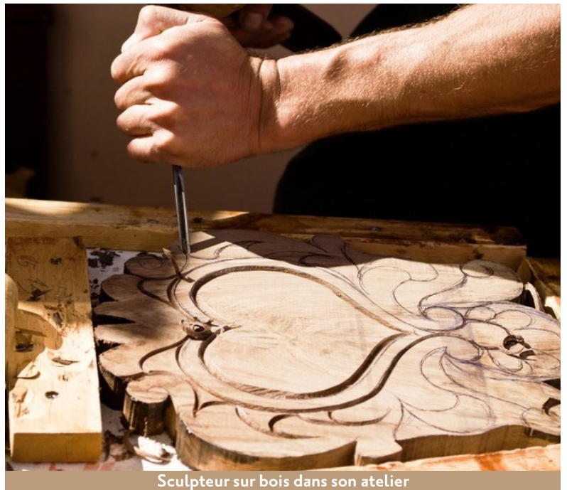
Sculpteur sur bois dans son atelier

Sous l'influence de la pensée antique qui est redécouverte à cette période, on commence à faire la distinction entre artiste et artisan, entre une oeuvre innovante, dénuée de finalité, tournée vers la recherche du beau, qui donne son mérite à son auteur, et un objet fonctionnel qui est le produit d'un savoir faire, sans avoir d'autre paternité que celle de l'atelier où il a été créé.